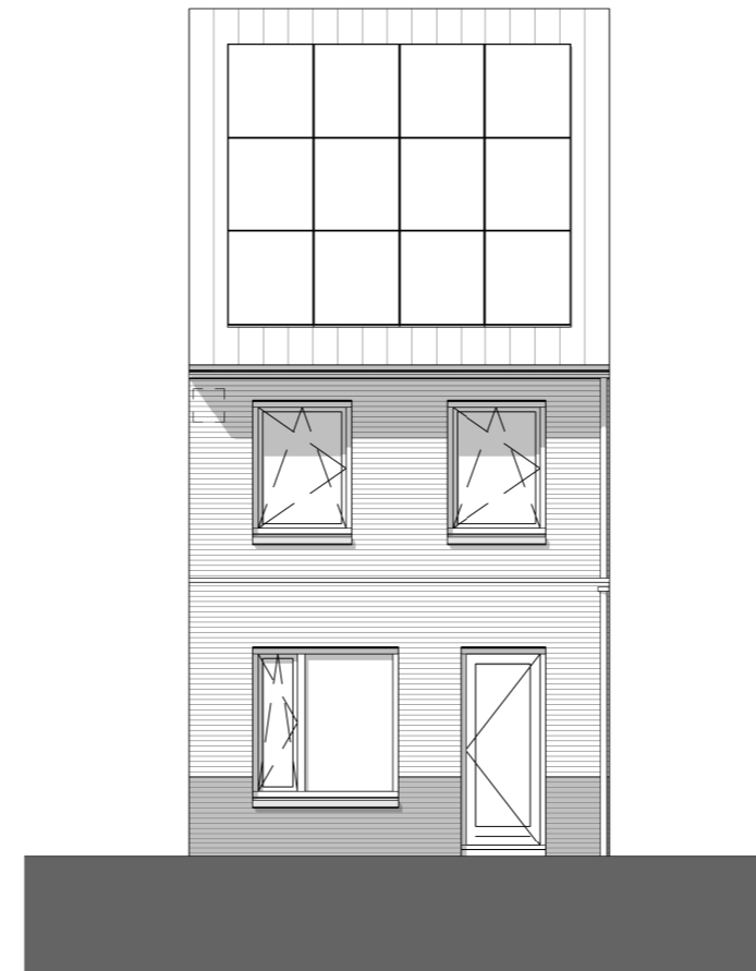
Achtergevel - optie uitbouw 120cm