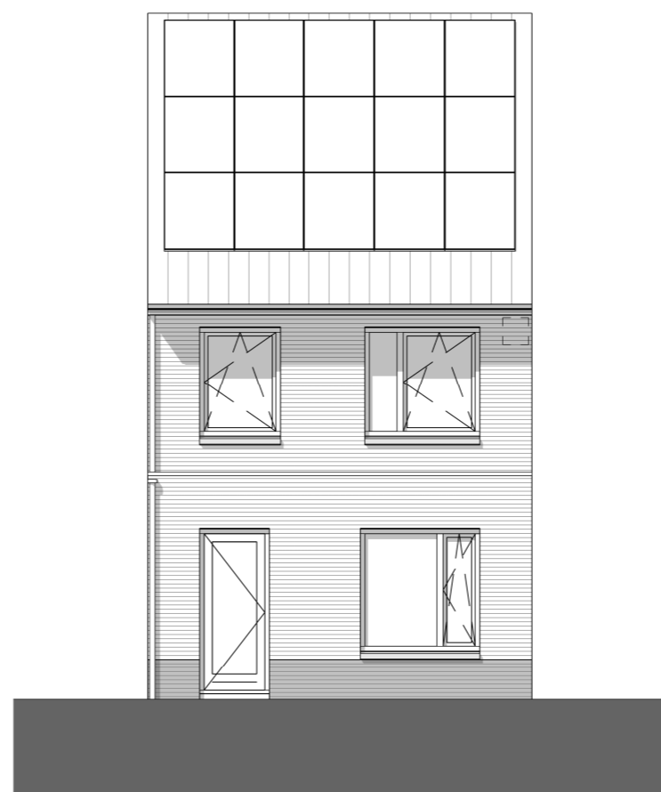
Achtergevel - optie uitbouw 120cm